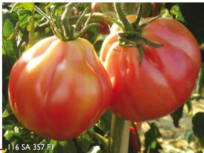
I 16 SA 357 FI