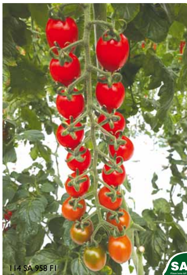
I 14 SA 958 FI

SAIS Il Buon Seme Dal 1941 PROFESSIONALE