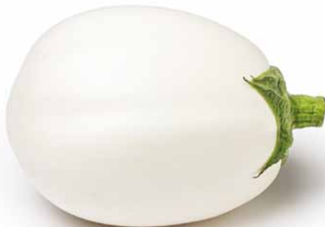
I 17 SA 391 FI