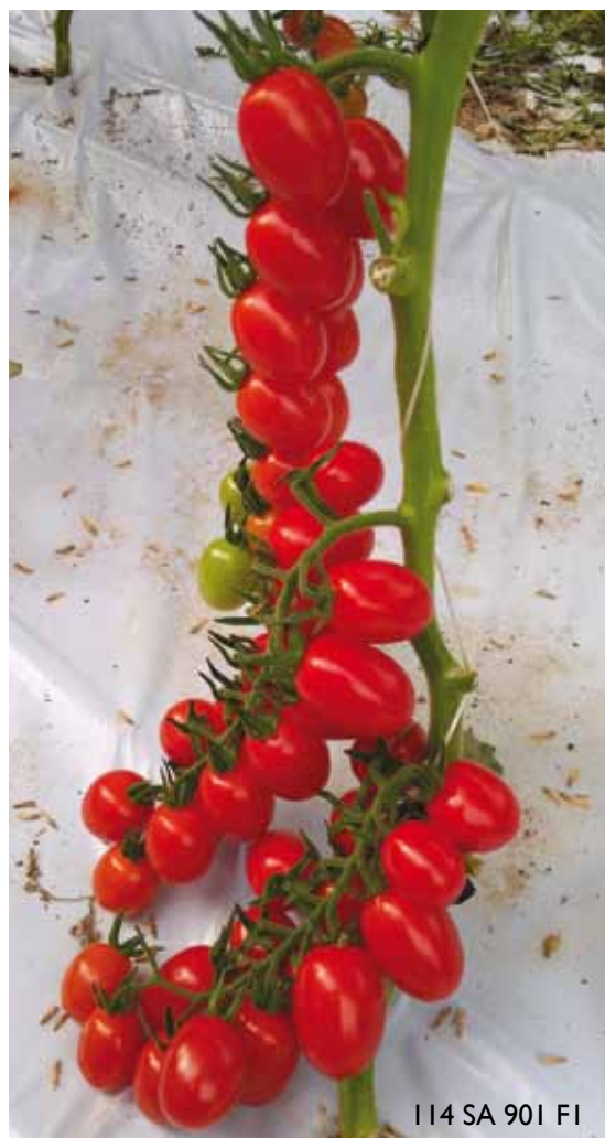
I 14 SA 901 FI