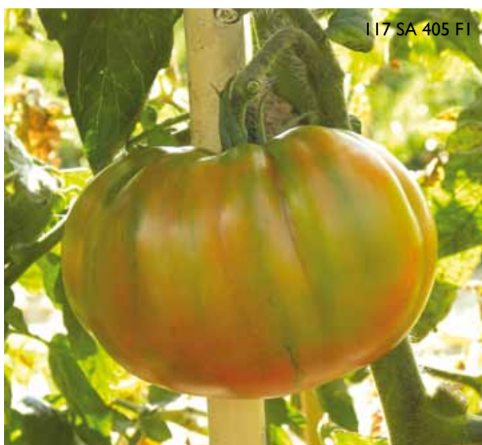
I 17 SA 405 FI