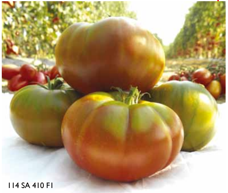
114 SA 410 FI