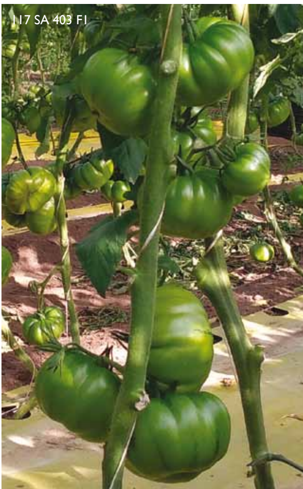
I 17 SA 403 FI